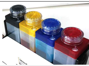
신형 그림 1-14

에어홀 마개작은 구멍의 고무 캡을 열어주세요. 잉크 충전시에는 막아주세요.