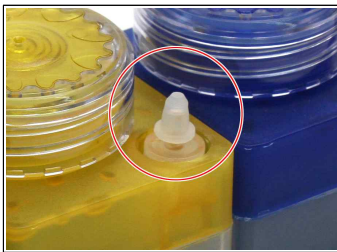
신형 그림 1-13

에어홀 마개작은 구멍의 고무 캡을 열어주세요. 잉크 충전시에는 막아주세요.