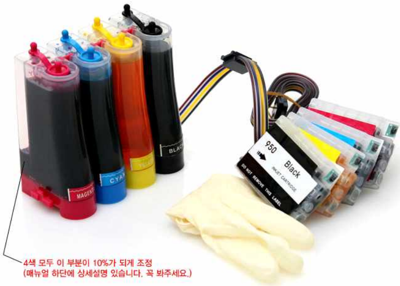
4색 모두 이 부분이 10%가 되게 조정 (매뉴얼 하단에 상세설명 있습니다. 꼭 봐주세요.)