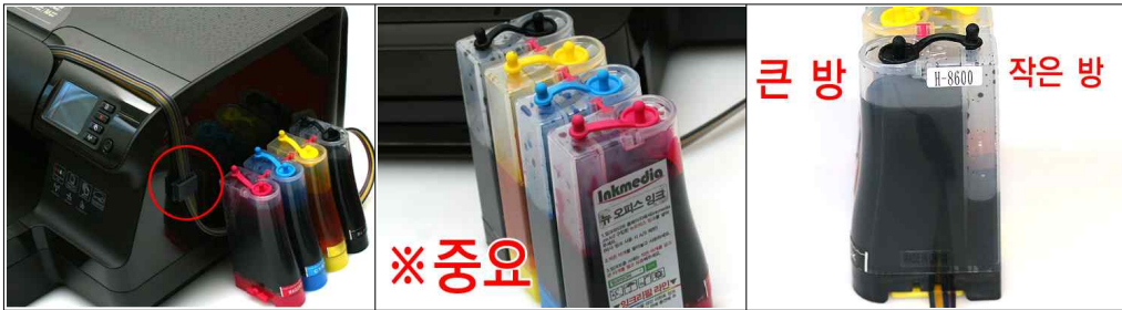
신형 그림 1-16 신형 그림 1-17 신형 그림 1-18 사진처럼 케이블을 정리해주고, 두 번째 고정 클립을 프린터 벽면에 부착해서 고정해줍니다. HP8600도 측면에 부착해주세요. 이제 외부잉크탱크의 작은 잉크탱크쪽 잉크량을 조절해줍니다. 이제부터 자세히 봐주세요. 사진에서 보는 것처럼 외부잉크탱크의 큰 방과 작은 방의 검색 잉크량이 차이가 나는 것이 보입니다. 작은 방의 잉크량은 4색 모두 항상 10%이하 정도로 유지되어야 합니다.