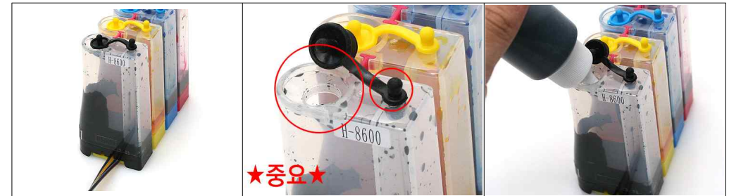
그림4-1 그림 4-2 그림 4-3 검색 큰잉크방과 작은 잉크방의 잔량 차이가 크게 나지 않습니다. 잉크 충전을 합니다. 사진을 잘보주세요. 작은 마개는 닫고 그 이후에 큰 마개를 열어주세요. ★작은 마개 닫기 → 큰 마개 열기★ 이제 해당 색에 맞는 잉크를 리필해줍니다. 뉴오피스 잉크입니다.

인쇄량이 많을 경우 잉크탱크의 잔여 잉크량이 많이 소진되어 충전해야할 경우가 발생합니다. 잉크탱크의 큰 잉크방에 잉크량이 작은 잉크방의 잉크잔량과 근접해지면 그 이전에 큰 잉크방에 잉크를 충전해주세요.