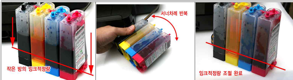
신형 그림 1-19 신형 그림 1-20 신형 그림 1-21 현재 작은 방 내부에 잉크가 50%이상 가득 차 있습니다. 이곳을 10%미만으로 비워줍니다. 사진처럼 잉크를 기울였다가 세웠다가를 반복해줍니다. 그러면 서로 아래쪽으로 이어진 통로를 통해 잉크와 공기가 이동합니다. 서너차례 반복해주시면 해당사진처럼 작은 방의 잉크가 10%정도만 남게 됩니다. 이후에는 압력에 의해 자동 조절 되므로 한번씩 확인만 해주시면 됩니다.