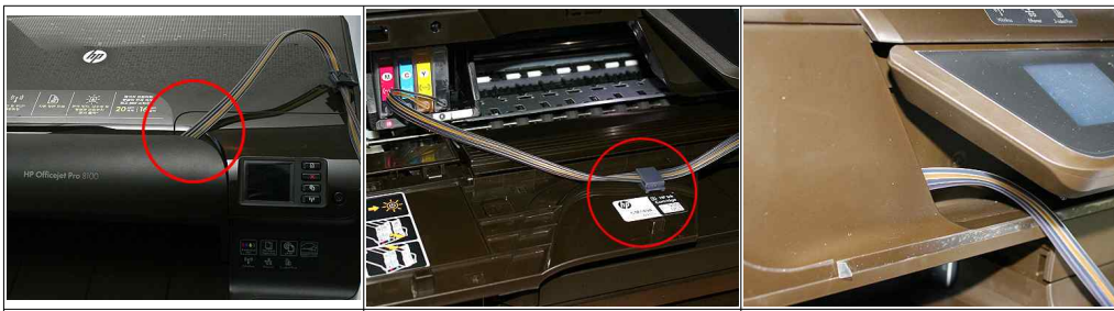
신형 그림 1-13 신형 그림 1-14 신형 그림 1-15 이제 뒷덮개를 닫고 정면덮개를 닫을 때 케이블을 사진처럼 정리해주세요. 전원이 켜져 있으면 내부에 카트리지가 이동을 시작합니다. HP8600의 경우 그림처럼 덮개의 스티커 바로 뒷부분에 부착해주세요. 나머지는 8100과 같습니다. HP8600은 덮개를 닫았을 때 그림처럼 잉크호스가 빠져주면 정상설치된 것입니다.