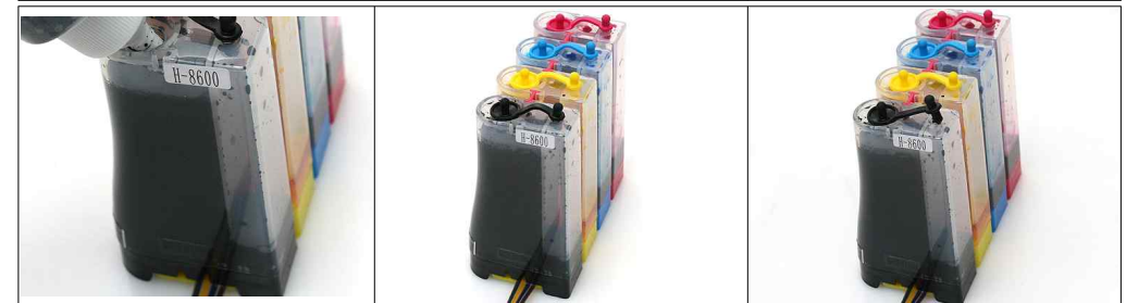
그림4-4 그림 4-5 그림 4-6 한계선까지 잉크가 보충되고 있습니다. 90% 정도만 충전해주세요. 충전이 완료되었습니다. 큰 마개를 닫고 작은 마개를 다시 열어주세요. 잉크 충전 완료입니다.