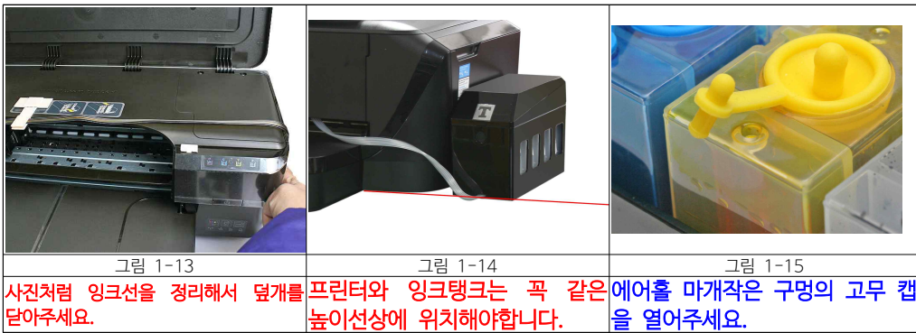
그림 1-13 사진처럼 잉크선을 정리해서 뒷개를 닫아주세요. 그림 1-14 프린터와 잉크탱크는 꼭 같은 높이선상에 위치해야합니다. 그림 1-15 에어홀 마개작은 구멍의 고무 캡을 열어주세요.